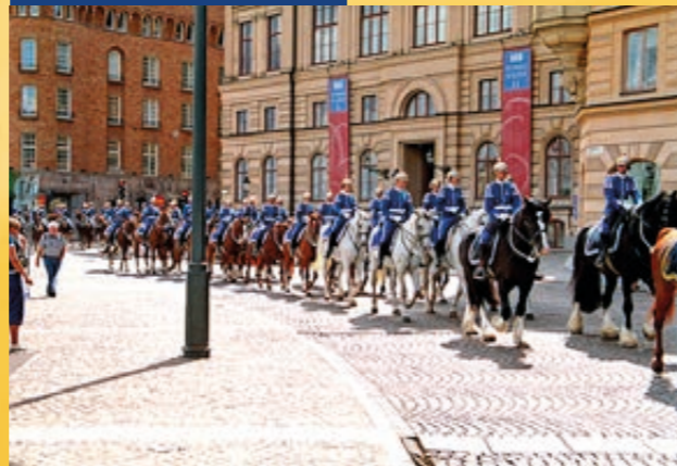
A Svéd Királyi Gárda felvonulása