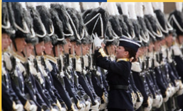
A Nagyherceg születésnapjára felvonulása