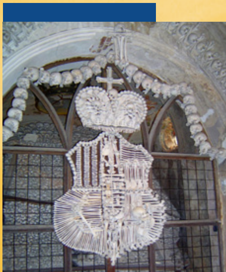
Koponya-templom, Kutna Hora