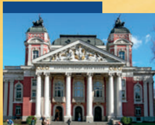
Szófia, Ivan Vazov Nemzeti Színház

Amennyiben a fenti, általános tájékoztató elolvasása után még további, konkrét kérdései lennének, forduljon hozzánk bizalommal: