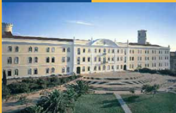
Lisszaboni Tudományegyetem, Közgazdaságtudományi Kar