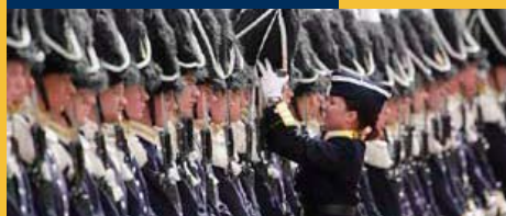
A Nagyherceg születésnapján felvonulása

Az Európai Unió tagállamainak az állampolgárai az Európai Egészségbiztosítási Kártya és az útlevel/személyi igazolvány felmutatásával, a litván állampolgárokéval meg egyező egészségügyi ellátásra jogosultak. (Az Európai Egészségbiztosítási Kártyát Magyarországon a lakóhely szerint illetékes OEP kirendeltségen lehet beszerezni.)