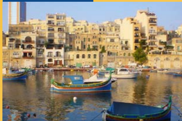
St. Julians kikötő

Hivatalos név: Málta Elhelyezkedés: Dél-Európa, szigetország a Földközi-tengeren Terület: 316 km 2 Népesség: 394 583 fő Főváros: Valletta Államforma: köztársaság Hivatalos nyelv: máltai, angol Hivatalos fizetőeszköz: euró (1 € = kb. 280 HUF) Vallás: katolikus, egyéb Időzóna: közép-európai idő (CET) Hívószám: +356