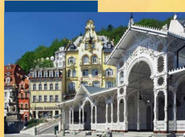
Karlovy Vary, Karlsbad