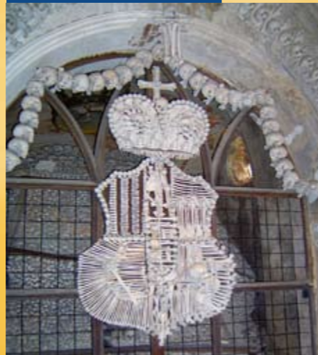
Koponya-templom, Kutna Hora